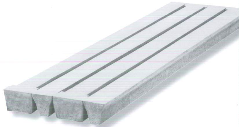
Otte-Einzelspaltenboden, der variable Boden für alle Anforderungen.